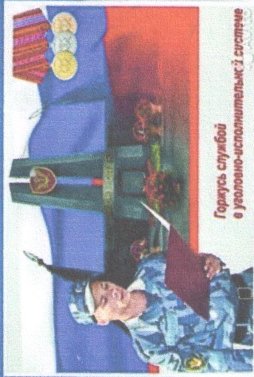
Горжусь службой в условно-исполнительской системе